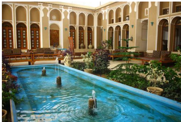
تصویر ۸. خانه مظفر در شهر یزد، از اماکن میراث معماری کویر مرکزی ایران. از آن به‌عنوان اقامتگاه گردشگران استفاده می‌شود.

علاوه بر فضاهایی که اصالتاً در آن‌ها فعالیت‌های موسیقایی شکل می‌گیرد، می‌توان اماکنی را که دارای پتانسیل‌های فرهنگی‌اند برای کاربردهای چندگانه، که اجرا یا آموزش موسیقی یکی از چنین کارکردهایی است، اختصاص داد. از باب نمونه، در مجموعه سعدی، در شهر شیراز، کارگاه‌هایی برای تولید و عرضه صنایع دستی این شهر اختصاص داده شده است که گردشگران این مجموعه، علاوه بر بهره‌مندی از فضای آرامگاه این شاعر نیکوسخن شعر فارسی، از این کارگاه‌ها دیدن می‌کنند.