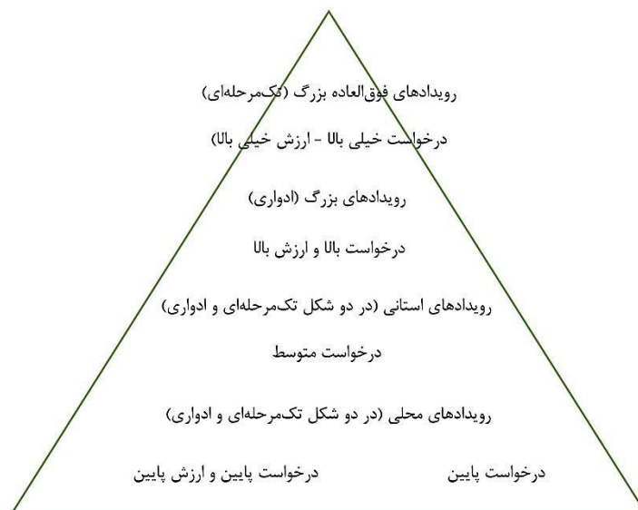
تصویر ۲. هرم انواع رویدادهای گردشگری براساس میزان اهمیت، تناوب تکرار، و بهره‌های اقتصادی. مأخذ: Getz, 2005