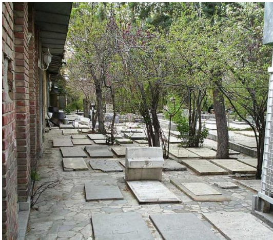
تصویر ۶. آرامگاه ظهیرالدوله در منطقه دربند تهران.

در فرهنگ ایرانی آرامگاه اشخاص از جایگاه خاصی برخوردار است. ایرانیان با حضور بر سر مزار افراد موردعلاقه خود، ضمن بزرگداشت آنان، از نیکی‌های آنان یاد می‌کنند. هنرمندان از قدیم‌الایام در اماکن خاصی خاک‌سپاری می‌شده‌اند و افراد برای ادای احترام و یادکرد آنان به این اماکن مراجعه می‌کرده‌اند. یکی از این مکان‌های مهم آرامگاه ظهیرالدوله است که شمار زیادی از هنرمندان موسیقی ایران در آن آرمیده‌اند (تصویر ۶). این آرامگاه یکی از قطب‌های گردشگری موسیقی تهران شناخته می‌شود. ایرج‌میرزا در سال ۱۳۰۴ و درویش‌خان در سال ۱۳۰۵ نخستین هنرمندانی بودند که در این گورستان به خاک سپرده شدند و بعدها نیز افرادی مانند ابوالحسن صبا و قمرالملوک وزیری در این مکان دفن شدند.