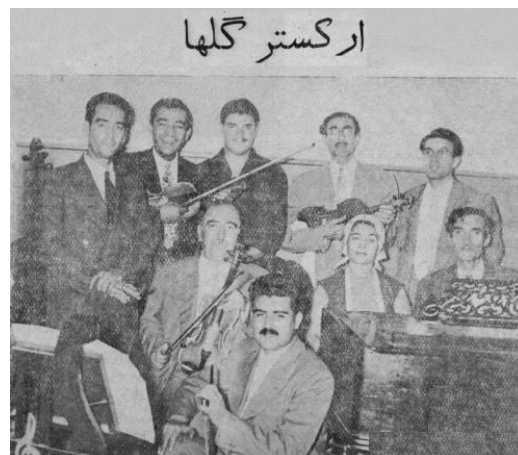
تصویر ۵. صبا و ارکستر او در استودیوی گل‌ها در رادیو ایران، ۱۳۳۶.

استودیوهای قدیمی که خوانندگان و نوازندگان آثار ماندگار خود را در آن‌ها ضبط کرده‌اند برای خود این هنرمندان و علاقه‌مندان به آن آثار همواره بسیار خاطره‌انگیز است. در ایران استودیوهای قدیمی بسیاری هست که بیشتر آن‌ها مربوط به رادیو و تلویزیون ملی ایران است. تعدادی استودیوی خصوصی در ایران هست که اغلب آن‌ها در شهر تهران قرار دارد. تصویر ۵، که در استودیوی گل‌ها در رادیو گرفته شده است، صحنه‌ای به‌یادماندنی از نواهای آن روزگار را توسط ابوالحسن صبا و سایر نوازندگان ارکستر او در سال ۱۳۳۶ به نمایش می‌گذارد.