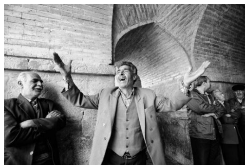
تصویر ۴. آواز خوانندگان حرفه‌ای و آماتور در زیر رواق‌های پل خواجه در اصفهان.

خوانندگان صاحب‌نام و خوانندگان جوان هر دو گروه از رواق‌های ایجادشده در زیر پل‌های خواجه و سی‌وسه‌پل برای خواندن آواز استفاده می‌کرده‌اند. امروزه گردشگران دقیقی را در این رواق‌ها می‌نشینند. این دقایق برای آنان یادآور آوازهایی است که در این مکان خوانده می‌شده است. برخی گردشگران با قرارگرفتن در این فضا خود نیز حال و هوای آواز خواندن پیدا می‌کنند و برای خود آوازهایی زمزمه می‌کنند (تصویر ۴).